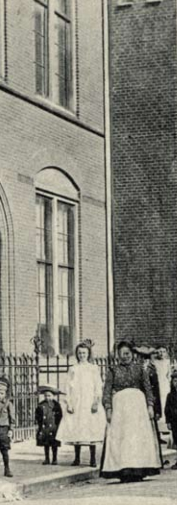
LINKS EEN DEEL VAN DE R. K. PAROCHIALE SCHOOL VOOR JONGENS, ADRIAANSTRAAT UTRECHT