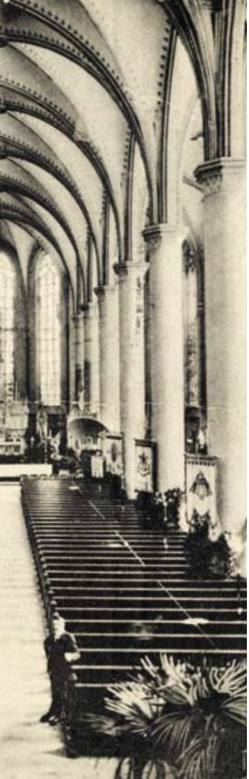
DE O. L. VROUWEKERK AAN DE BILTSTRAAT

al was het de opzet dat elk kwartaal een aflevering het licht zou zien. Dat werd echter bij lange na niet gehaald, terwijl ook in de overige activiteiten van het gilde als nel een neergaande lijn te constateren was. De vergaderingen werden weliswaar volgens schema gehouden, maar steeds minder bezocht, terwijl Herman Schaeapman klaagde over het autocratisch karakter van het gilde, vooral omdat hij er zelf zo weinig in te zeggen had. Van Heukelum stelde na tien jaar vast, dat de uitgangspunten van het gilde nu overal aanvaard werden. Dat wees er volgens hem op dat nu ook gerust leken als volwaardige leden konden worden toegelaten. Drie van hen, onder wie Leo Tepe, broer van Alfred, en Willem Mengelberg, werden zelfs tot bestuurslid benoemd. Met het gilde ging het op en af omdat veel parochiepriesters hier niet hun prioriteit zagen, en er waren zelfs periodes dat er geen jaarverslagen verschenen. Daarvan zijn allerlei oorzaken te bedenken, maar de voornaamste was dat pastoor Van Heukelum in zijn nadagen was en geen of weinig leiding meer kon geven. Zijn zwarte hardos was in Jutphaas spierwit geworden, ook zijn gezondheid ging steeds meer achteruit, maar plaats maken voor een ander, dat wilde hij niet. Het Bernulphus Gilde was zijn gilde, hij had er vanaf het begin de koers van bepaald en wilde dat die ook in de toekomst zou worden gevolgd.