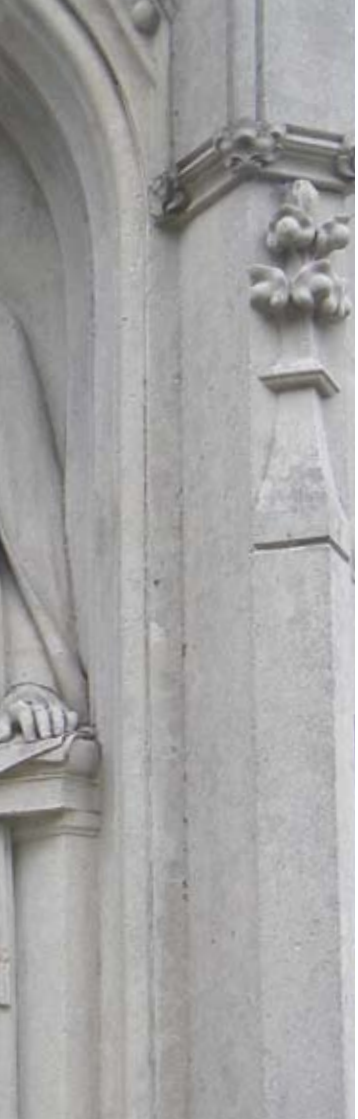
DETAIL VAN HET SCHAEPMANMONUMENT IN RIJSENBURG

stelselmatig gaat. De doctor was nu eenmaal meer een man van de gloeiende frase dan van het doorwrochte betoog. Bij zijn leven, vanaf het moment van zijn terugkeer als gepromoveerd theoloog uit Rome in 1870, was zijn woord ook op het terrein van de kerkelijke kunst van groot gewicht. Hij rustte niet voor hij het zover gekregen had, omdat hij nu eenmaal overal waar hij verscheen de eerste viool wilde spelen. Hij kreeg die kans omdat er in het katholieke milieu te weinig specialisten waren om hem tegenspel van enige betekenis te kunnen bieden. In het land van mensen die nog nauwelijks het schemerdonker van hun tweederangs burgerschap ontwend waren, was Herman Eenoog gemakkelijk koning.