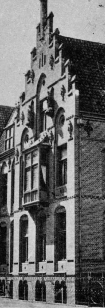
HET WOONHUIS VAN TEPE AAN DE UTRECHTSE MALIEBAAN