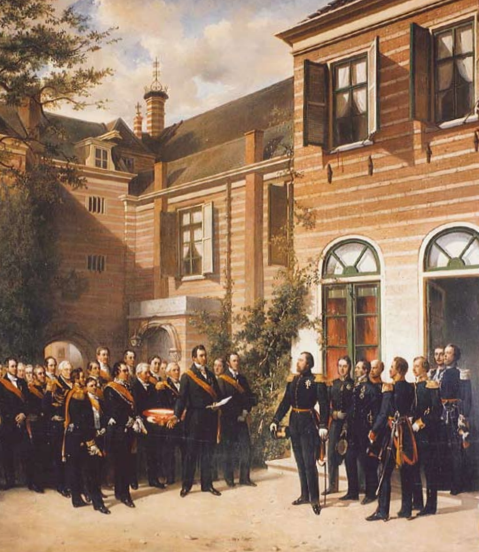
AANBIEDING VAN EEN ADRES AAN KONING WILLEM III OP DE BINNENPLAATS VAN PAUSHUIJZE (NICOLAAS PIENEMAN 1856)