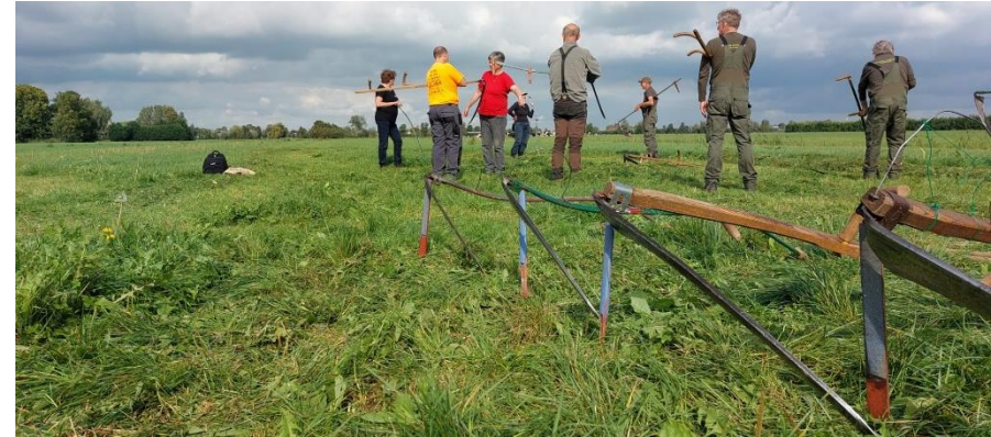
De cursus Maaien met de zeis op 30 september 2023.

in 2023 vonden 21 cursussen plaats: vier keer de cursus veldhulpverlening, twee keer bosmaaien, elf keer motorkettingzagen, twee keer maaien met de zeis en twee keer heggenvlechten.