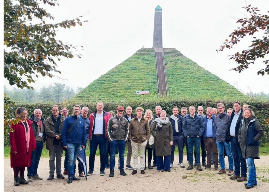
Partnerdag bij de Pyramide van Austerlitz.