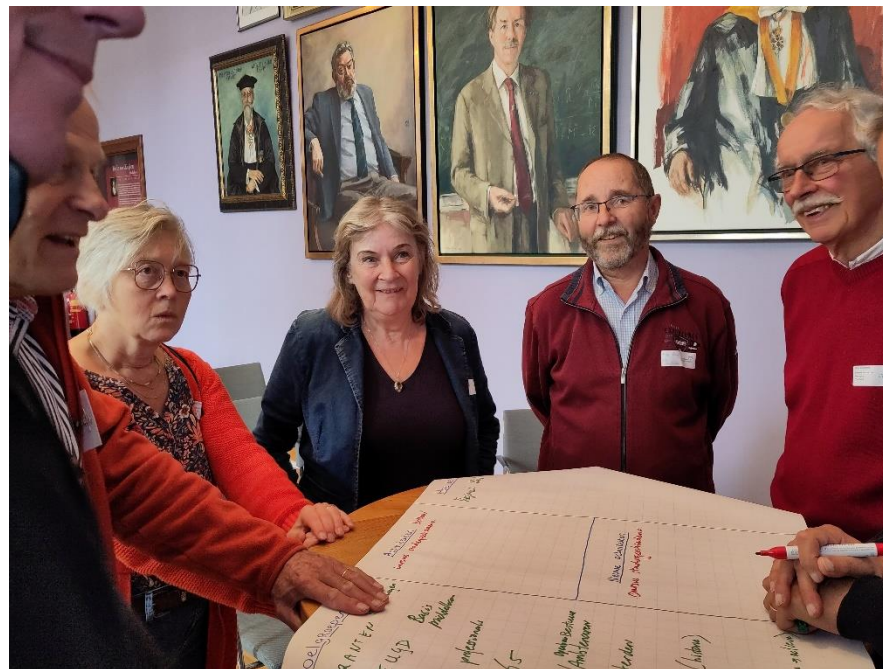
Mooie discussies tijdens de netwerkdag historische verenigingen.

Op zaterdag 14 oktober verzamelden veertig vrijwilligers van historische verenigingen zich in het Academiegebouw van Universiteit Utrecht. Zij voerden discussies over de rol van de verenigingen en het bereiken van (nieuwe) doelgroepen. Dit leverde veel nieuwe kennis en inspiratie op. De netwerkdag werd samen met de Historische Vereniging Oud-Utrecht dat in 2023 haar 100-jarig bestaan vierde. De deelnemers aan de netwerkbijeenkomst waren ook uitgenodigd voor het symposium ter gelegenheid van dit jubileum.