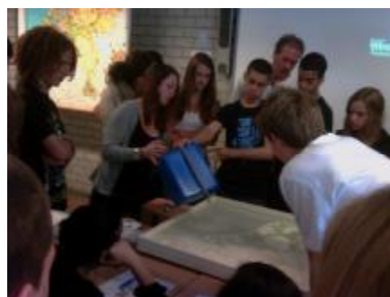
Aan het werk met het 3D-overstromingsmodel

Om een antwoord op deze vraag te vinden, gaan de leerlingen gaan aan de slag met werkblad 2. Zij werken in groepjes in de werkvorm 'placemat'.